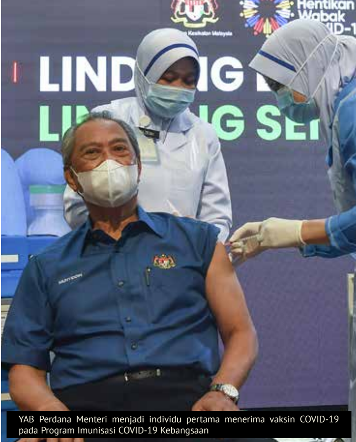
YAB Perdana Menteri menjadi individu pertama menerima vaksin COVID-19 pada Program Imunisasi COVID-19 Kebangsaan