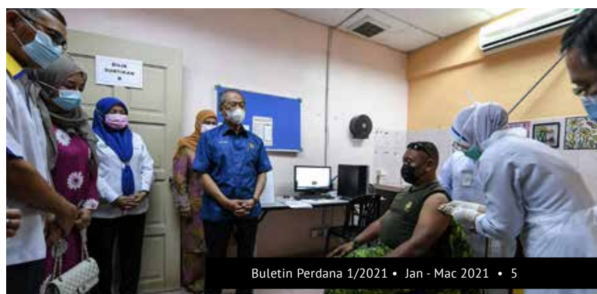
YAB Perdana Menteri ketika melawat Pusat Pemberian Vaksin (PPV), Klinik Kesihatan Kampung Gial, Arau, Perlis