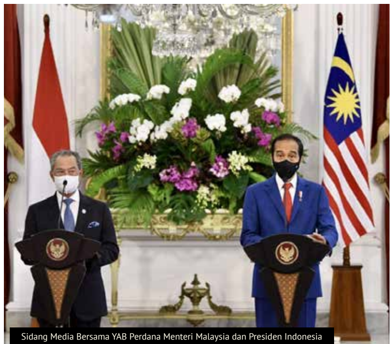
Sidang Media Bersama YAB Perdana Menteri Malaysia dan Presiden Indonesia

P ADA 4 dan 5 Februari 2021 yang lalu, YAB Perdana Menteri, Tan Sri Dato' Sri Haji Muhyiddin bin Haji Mohd. Yassin telah mengadakan lawatan rasmi ke Republik Indonesia yang merupakan lawatan rasmi pertama YAB Perdana Menteri sejak beliau dilantik pada Mac 2020. Memandangkan pandemik Covid-19 khususnya di Malaysia dan Indonesia masih berlarutan, YAB Perdana Menteri sendiri meminta agar lawatan rasmi bagi