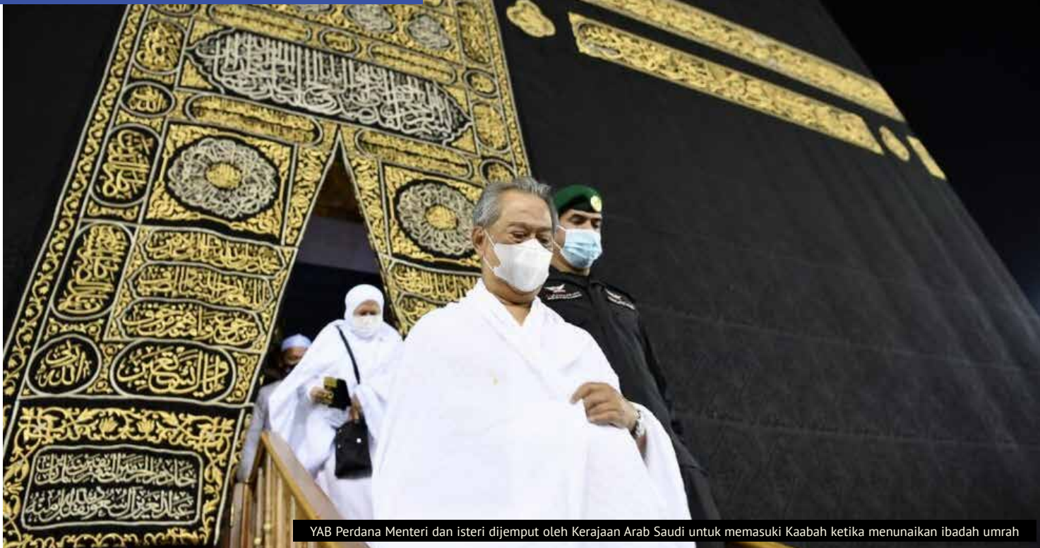
YAB Perdana Menteri dan isteri dijemput oleh Kerajaan Arab Saudi untuk memasuki Kaabah ketika menunaikan ibadah umrah