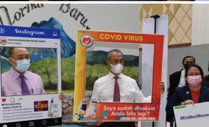
YAB Perdana Menteri ketika melawat Pusat Vaksinasi COVID-19 Daerah Kota Kinabalu di Kompleks Pentadbiran Kerajaan Persekutuan Sabah

https://www.facebook.com/ts.muhyiddin/posts/3793577387387459