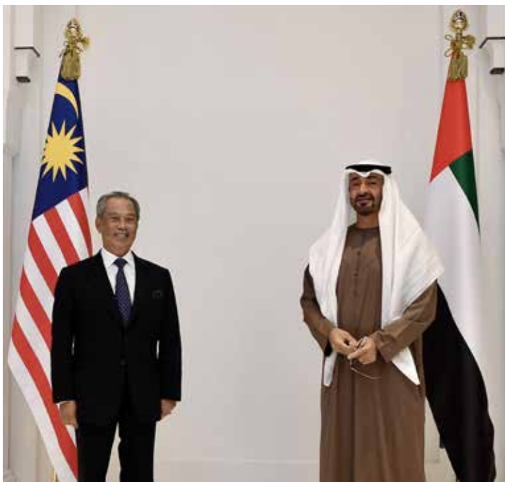
YAB Perdana Menteri bersama Putera Mahkota Abu Dhabi yang juga Komander Tertinggi Angkatan Tentera UAE, Sheikh Mohamed Zayed Al Nahyan