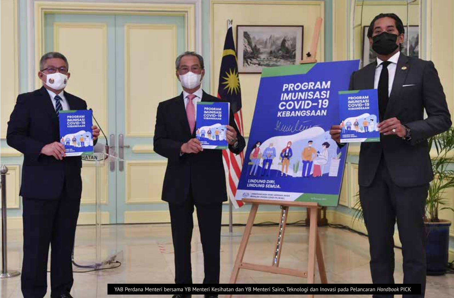
YAB Perdana Menteri bersama YB Menteri Kesihatan dan YB Menteri Sains, Teknologi dan Inovasi pada Pelancaran Handbook PICK