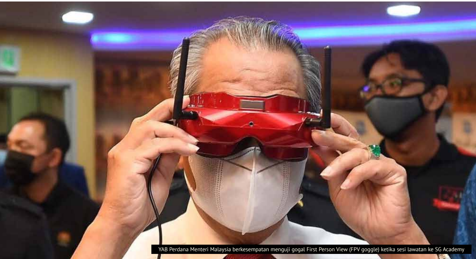
YAB Perdana Menteri Malaysia berkesempatan menguji gogal First Person View (FPV goggle) ketika sesi lawatan ke SG Academy

RAKAMAN LENSA BEBERAPA AKTIVITI RASMI YAB PERDANA MENTERI