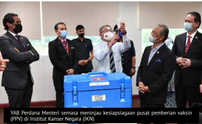
YAB Perdana Menteri semasa meninjau kesiapsiagaan pusat pemberian vaksin (PPV) di Institut Kanser Negara (IKN)