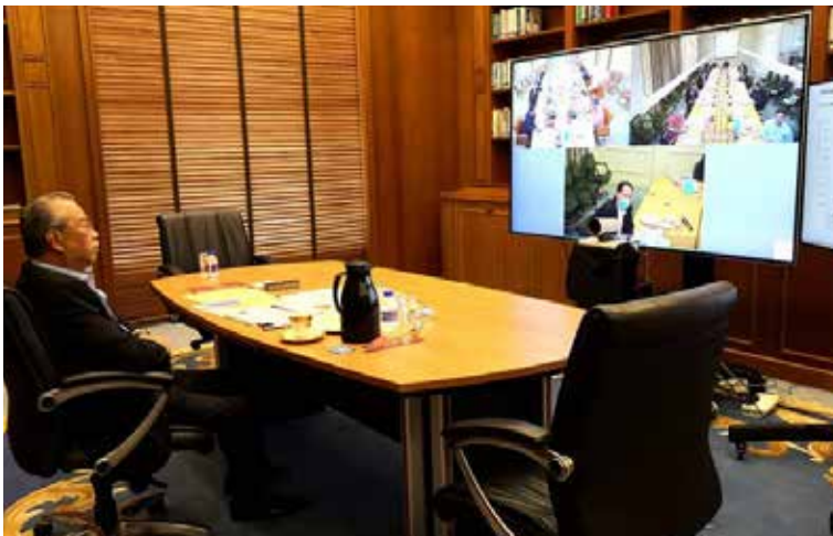
16 Januari 2021 - Sidang Darurat Majlis Keselamatan Negara (MKN)