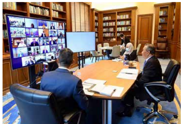
26 Januari 2021 - Mesyuarat pertama Majlis Kemakmuran Bumiputera (MKB)