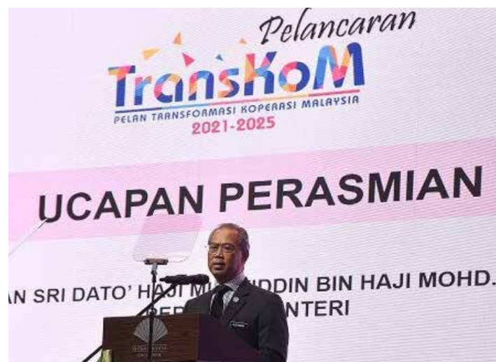
30 Mac 2021 - Majlis Pelancaran Pelan Transformasi Koperasi Malaysia 2021-2025 (TransKoM)