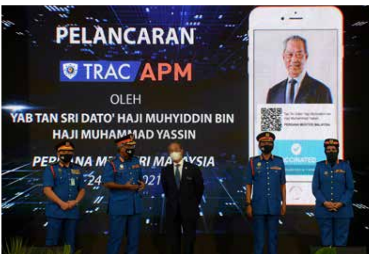
24 Mac 2021 - Majlis Pelancaran TRAC (APM) serta perasmian bangunan baharu Ibu Pejabat APM di Ibu Pejabat Angkatan Pertahanan Awam (APM) Sungai Merab, Kajang