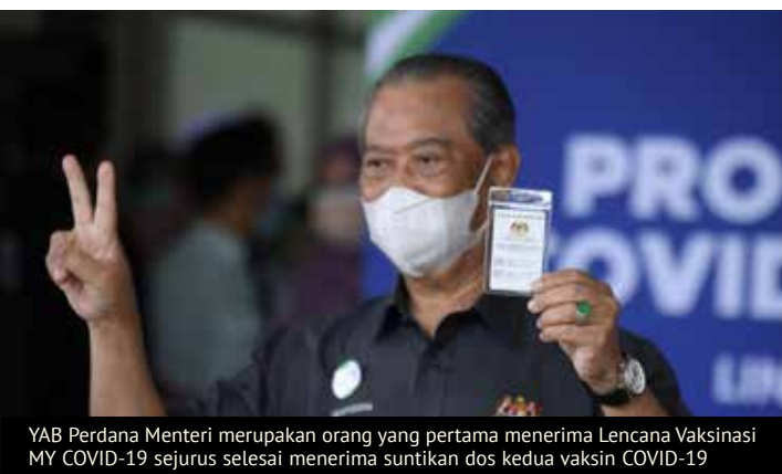
YAB Perdana Menteri merupakan orang yang pertama menerima Lencana Vaksinasi MY COVID-19 seurus selesai menerima suntikan dos kedua vaksin COVID-19