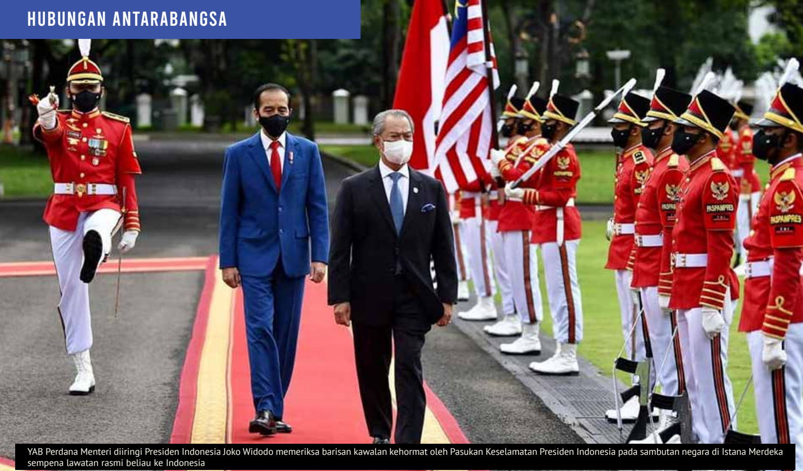
YAB Perdana Menteri diiringi Presiden Indonesia Joko Widodo memeriksa barisan kawalan kehormat oleh Pasukan Keselamatan Presiden Indonesia pada sambutan negara di Istana Merdeka sempena lawatan rasmi beliau ke Indonesia