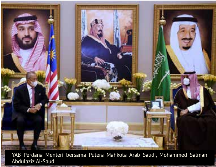
YAB Perdana Menteri bersama Putera Mahkota Arab Saudi, Mohammed Salman Abdulaziz Al-Saud