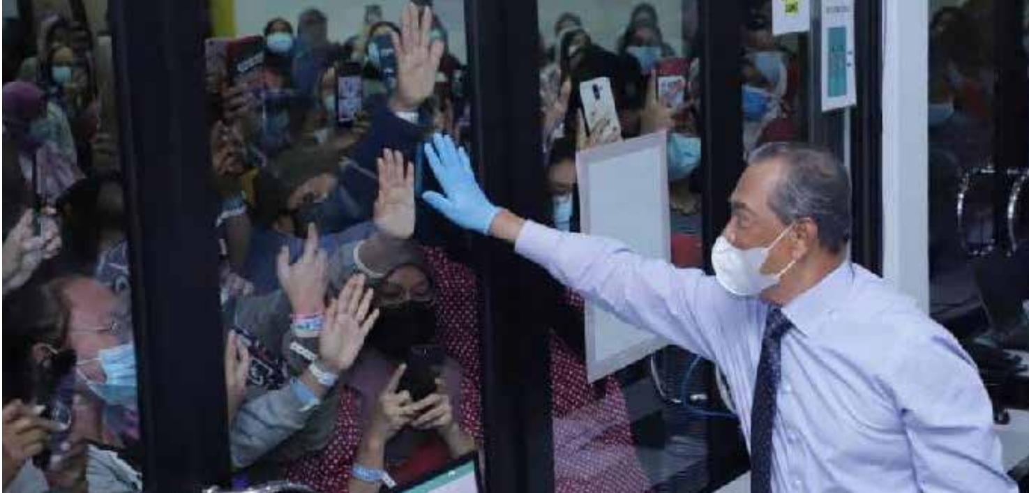
19 Januari 2021 - Tinjauan Pusat Kuarantin dan Rawatan Covid-19 2.0 (PKRC) di MAEPS, Serdang