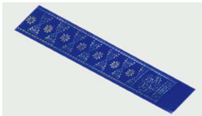
Warna dan Bahan