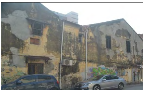
Lebuhraya Gereja - Cat Dinding Bangunan Yang Usang (06.07.2017)