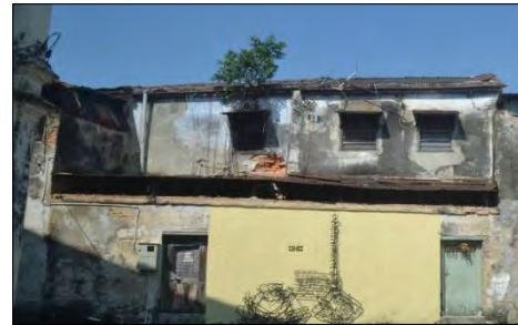
Lorong Lumut - Bangunan Yang Terdapat Tumbuhan Liar (05.07.2017)