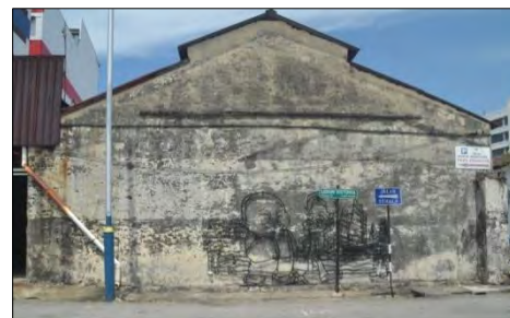
Lebuhraya Victoria - Cat Dinding Bangunan Yang Usang (06.07.2017)