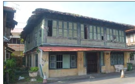
Lebuhraya Aceh - Bangunan Yang Telah Rosak Dan Tidak Dibaik Pulih (05.07.2017)