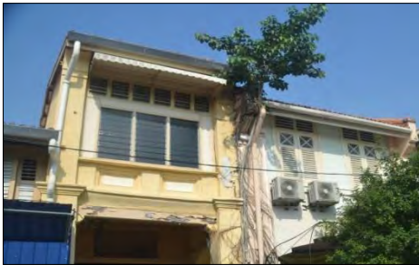
Lebuah Aceh - Bangunan Yang Terdapat Tumbuhan Liar (05.07.2017)