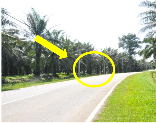
Gambar 2.1 Permulaan Jalan Alternatif Yang Direka bentuk Oleh Perunding

Lokasi: Sungkai Tarikh: 22 April 2014