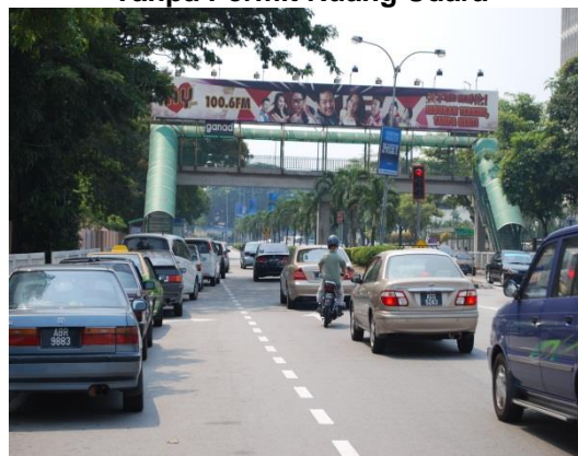
Gambar 1.17 Papan Iklan di Jejantas Tanpa Permit Ruang Udara

Lokasi: Daerah Ipoh Tarikh: 20 Mei 2014