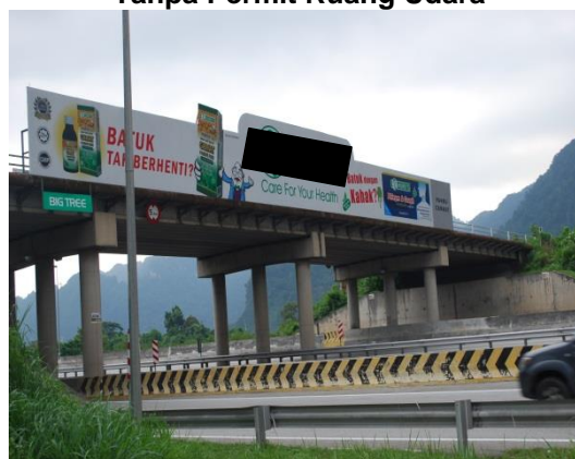
Gambar 1.15 Papan Iklan di Jejambat Tanpa Permit Ruang Udara

Lokasi: Daerah Ipoh Tarikh: 20 Mei 2014