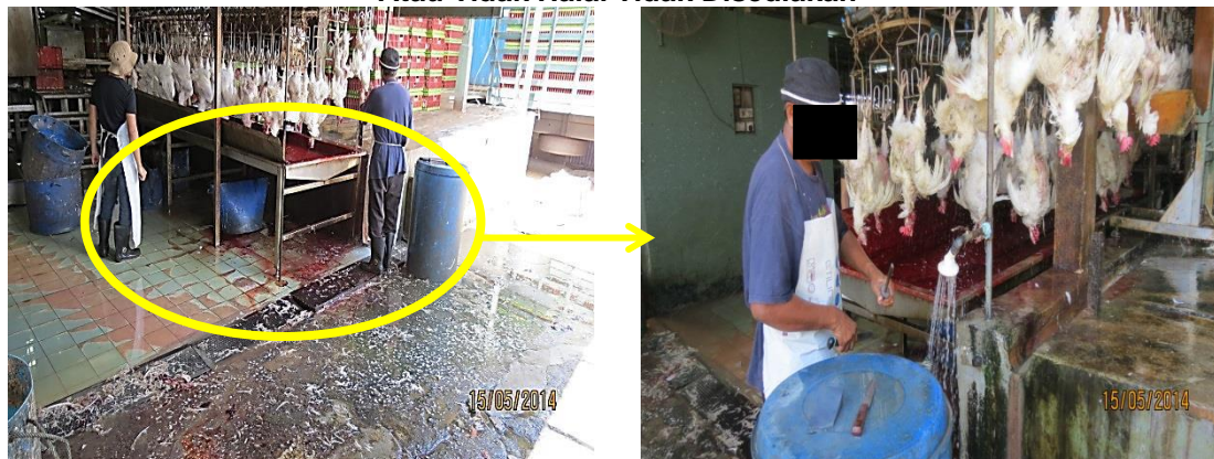
Gambar 3.9 Bekas Untuk Mengasingkan Sembelihan Yang Rosak Atau Tidak Halal Tidak Disediakan

Lokasi: Rumah Sembelihan Di Pusing Tarikh: 15 Mei 2014