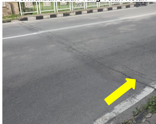
Gambar 2.8 Permukaan Jalan Yang Telah Retak

Lokasi: Jambatan Kampung Paloh, Ipoh Tarikh: 22 April 2014