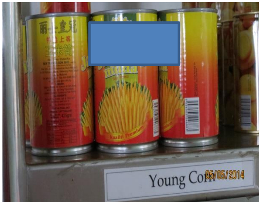
Gambar 3.3 Jagung Muda Dalam Tin Tanpa Sijil Halal

Lokasi: Hotel Di Ipoh Tarikh: 5 Mei 2014