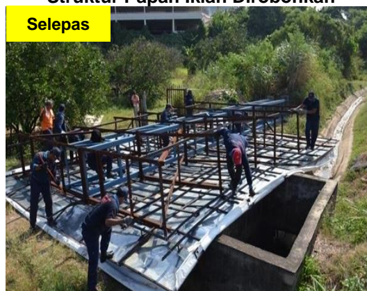
Gambar 1.6 Struktur Papan Iklan Dirobuhkan

Lokasi: Daerah Ipoh Tarikh: 2 Jun 2014