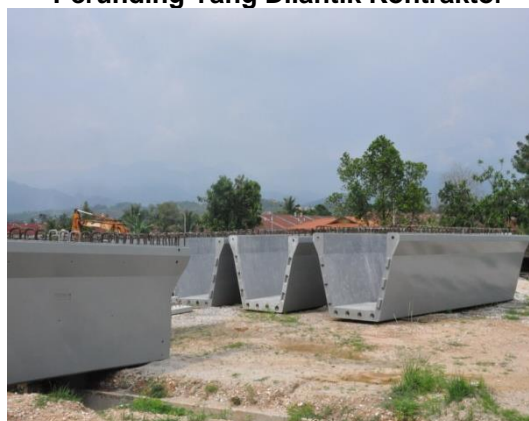
Gambar 2.3 Jambatan Sungai Choh Menggunakan pakai Reka Bentuk Perunding Yang Dilantik Kontraktor

Lokasi: Jalan Tambun, Tanjung Rambutan Tarikh: 22 April 2014