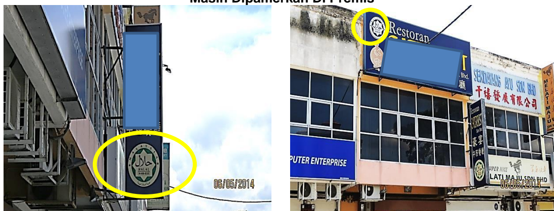
Gambar 3.1 Logo Halal Tamat Tempoh Masih Dipamerkan Di Premis

Lokasi: Premis Makanan Di Ipoh Tarikh: 6 Mei 2014