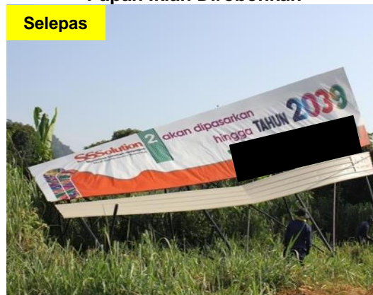
Gambar 1.12 Papan Iklan Dirobuhkan

Lokasi: Daerah Ipoh Tarikh: 20 Mei 2014