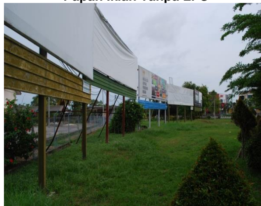
Gambar 1.10 Papan Iklan Tanpa LPS

Lokasi: Daerah Kerian Tarikh: 1 April 2014