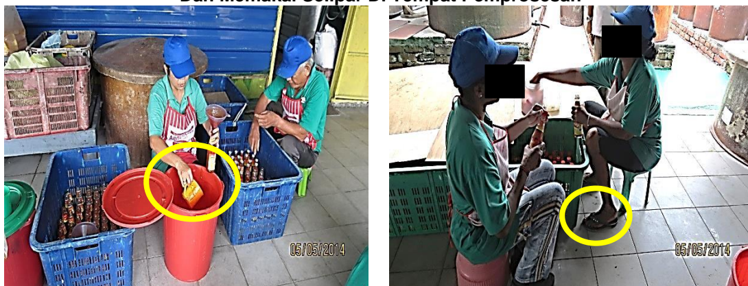
Gambar 3.6 Pekerja Memakai Perhiasan Diri, Tidak Memakai Sarung Tangan Dan Memakai Selipar Di Tempat Pemrosesan

Lokasi: Kilang Kicap Dan Sos Di Ipoh Tarikh: 5 Mei 2014