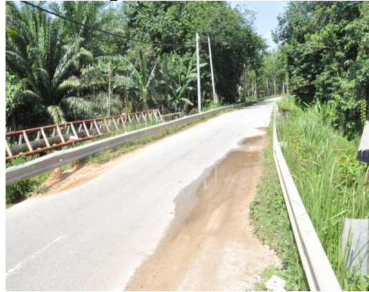
Gambar 2.11 Projek Pembinaan Jalan Baru Di Perkampungan Felda Yang Belum Dilaksanakan

Lokasi: Sungkai Tarikh: 22 April 2014