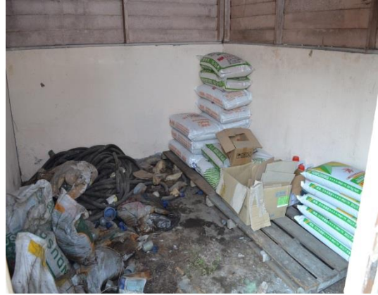
Gambar 4.2 Tempat Penyimpanan Input Kotor

Lokasi: Pejabat Pertanian Daerah Kinta Tarikh: 8 April 2014