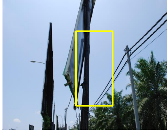
Gambar 1.19 Papan Iklan Lengkang Daripada Struktur

Lokasi: Daerah Hilir Perak Tarikh: 23 April 2014