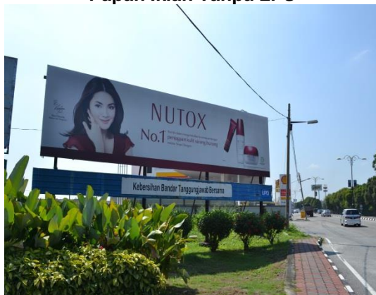
Gambar 1.7 Papan Iklan Tanpa LPS

Lokasi: Jalan Changkat Jong Hilir Perak Tarikh: 15 April 2014