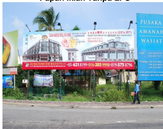
Gambar 1.2 Papan Iklan Tanpa LPS

Lokasi: Daerah Hilir Perak Tarikh: 24 April 2014