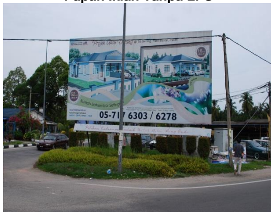
Gambar 1.9 Papan Iklan Tanpa LPS

Lokasi: Daerah Kerian Tarikh: 1 April 2014