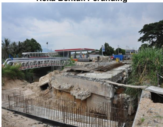
Gambar 2.2 Jambatan Sungai Choh Di Bina Tanpa Menggunakan pakai Reka Bentuk Perunding

Lokasi: Jalan Tambun, Tanjung Rambutan Tarikh: 22 April 2014