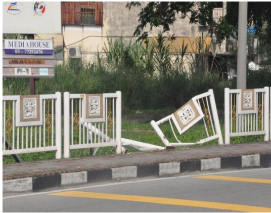
Gambar 2.9 Railing Jambatan Yang Rosak

Lokasi: Jambatan Kampung Paloh, Ipoh Tarikh: 22 April 2014