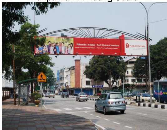
Gambar 1.16 Papan Iklan di Struktur Tanpa Permit Ruang Udara

Lokasi: Daerah Ipoh Tarikh: 26 Jun 2014