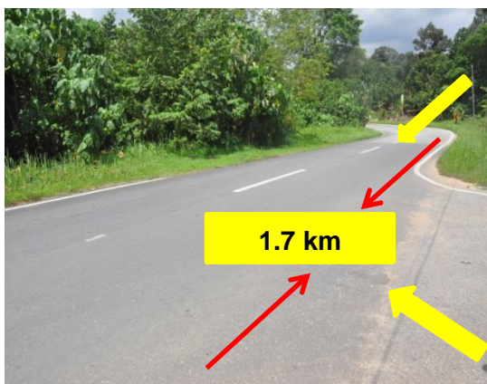
Gambar 2.6 Kerja Membarumuka Jalan Yang Siap Sepanjang 1.7km

Penyelenggaraan Jalan Negeri (MARRIS) berjumlah RM1.1 juta sepatutnya menggunakan peruntukan memperelok, melebar dan menaik taraf jalan sedia ada. Tiada bukti kerja penyelenggaraan dan membaik pulih dilaksanakan bagi jalan sepanjang 1.7 km menggunakan reka bentuk perunding seperti di Gambar 2.6 .