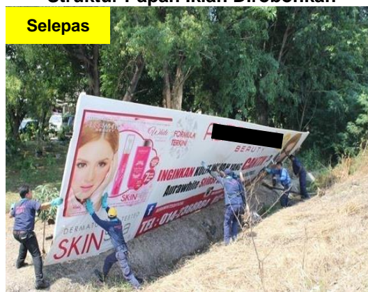
Gambar 1.4 Struktur Papan Iklan Dirobuhkan

Lokasi: Daerah Ipoh Tarikh: 2 Jun 2014