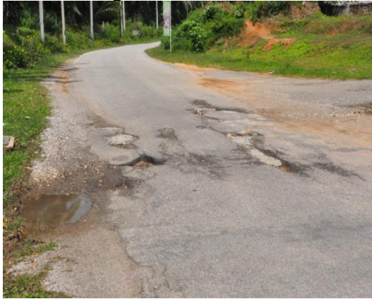
Gambar 2.10 Projek Pembinaan Jalan Baru Di Perkampungan Felda Yang Belum Dilaksanakan

Lokasi: Sungkai Tarikh: 22 April 2014