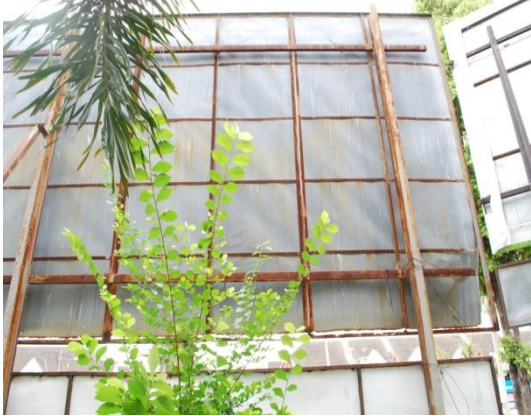
Gambar 1.18 Struktur Besi Papan Iklan Berkarat

Lokasi: Daerah Kerian Tarikh: 1 April 2014