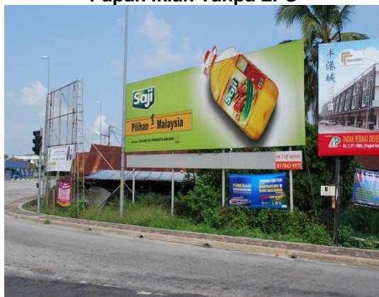
Gambar 1.1 Papan Iklan Tanpa LPS

Lokasi: Daerah Hilir Perak Tarikh: 24 April 2014