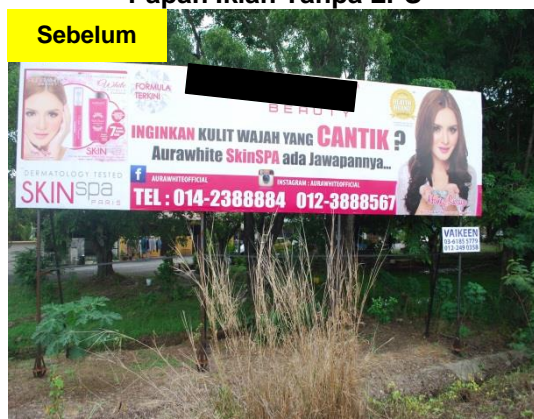
Gambar 1.3 Papan Iklan Tanpa LPS

Lokasi: Daerah Ipoh Tarikh: 20 Mei 2014