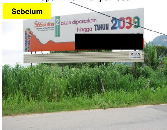
Gambar 1.11 Papan Iklan Tanpa Lesen

Lokasi: Daerah Ipoh Tarikh: 20 Mei 2014