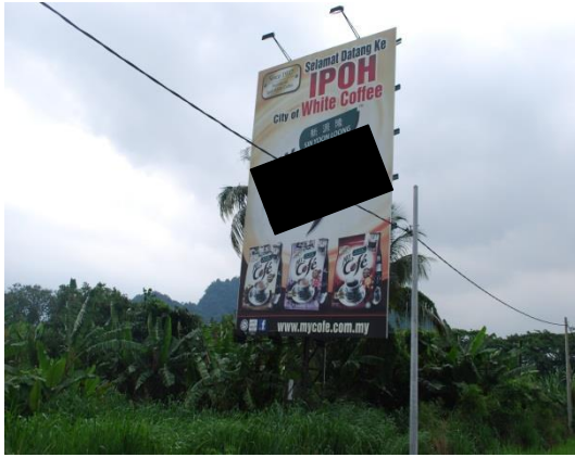
Gambar 1.13 Papan Iklan Tanpa Lesen

Lokasi: Daerah Ipoh Tarikh: 20 Mei 2014