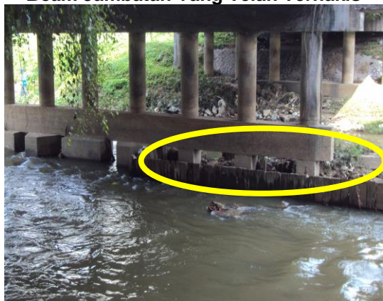
Gambar 2.7 Beam Jambatan Yang Telah Terhakis

Lokasi: Jambatan Kampung Paloh, Ipoh Tarikh: 22 April 2014