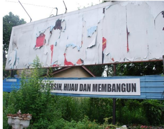
Gambar 1.21 Papan Iklan Tidak Disenggara

Lokasi: Ipoh Tarikh: 20 Mei 2014