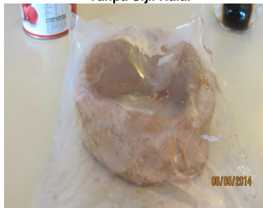
Gambar 3.5 Keladi Goreng Tanpa Sijil Halal

Lokasi: Premis Makanan Di Ipoh Tarikh: 6 Mei 2014