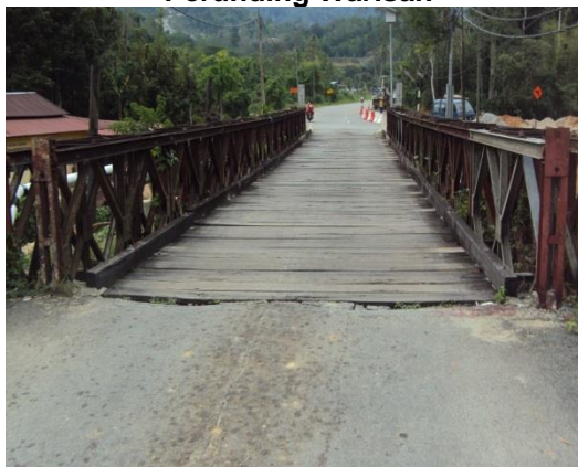
Gambar 2.5 Jambatan Di Kampung Banggol Belimbing Yang Tidak Mengguna pakai Reka Bentuk Jurutera Perunding Warisan

Lokasi: Kampung Banggol Belimbing, Lenggong Tarikh: 23 April 2014