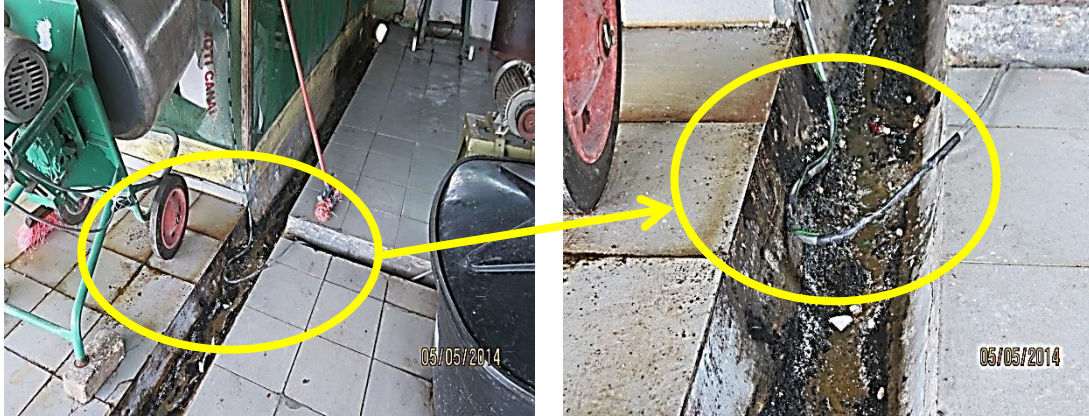
Gambar 3.8 Tempat Pemprosesan Produk Yang Kotor

Lokasi: Kilang Kicap Dan Sos Di Ipoh Tarikh: 5 Mei 2014