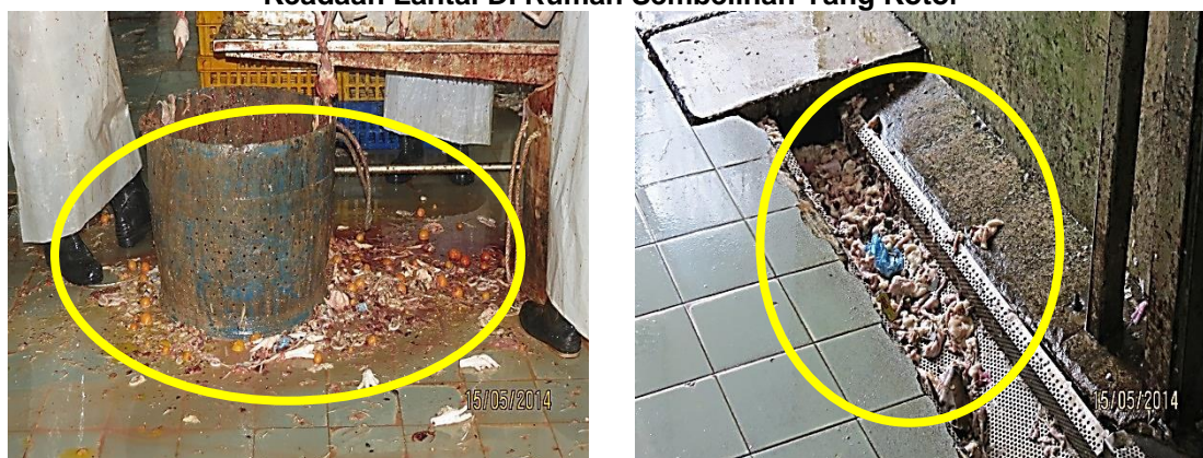
Gambar 3.10 Keadaan Lantai Di Rumah Sembelihan Yang Kotor

Lokasi: Rumah Sembelihan Di Pusing Tarikh: 15 Mei 2014