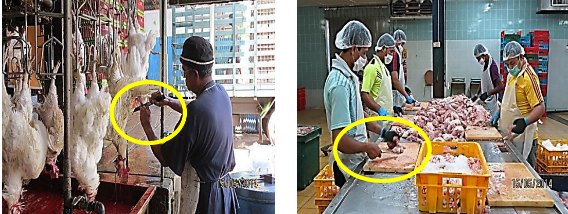
Gambar 3.11 Pekerja Di Tempat Pemrosesan Tidak Memakai Sarung Tangan

Lokasi: Rumah Sembelihan Di Pusing Tarikh: 15 Mei 2014