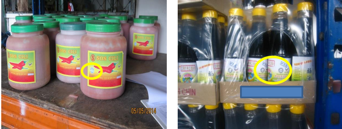
Gambar 3.2 Penggunaan Logo Halal Yang Tidak Diluluskan

Lokasi: Kilang Kicap Dan Sos Di Ipoh Tarikh: 5 Mei 2014