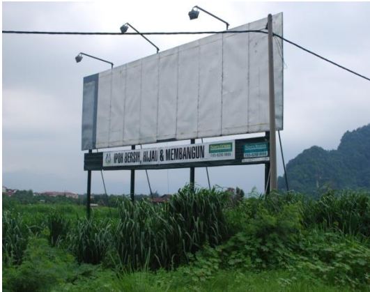
Gambar 1.20 Papan Iklan Kosong Dan Semak Samun

Lokasi: Ipoh Tarikh: 20 Mei 2014