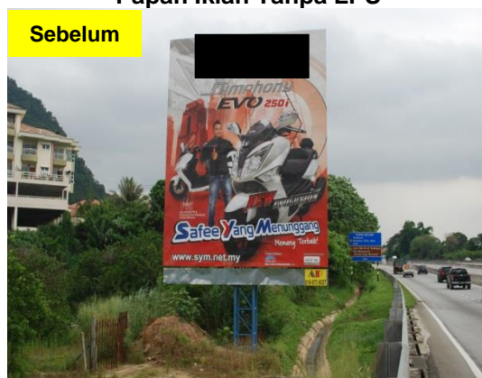
Gambar 1.5 Papan Iklan Tanpa LPS

Lokasi: Daerah Ipoh Tarikh: 20 Mei 2014