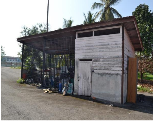
Gambar 4.1 Tempat Penyimpanan Input Tidak Berkunci

Lokasi: Pejabat Pertanian Daerah Kinta Tarikh: 8 April 2014