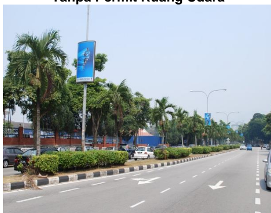
Gambar 1.14 Kotak Iklan Lampu Tanpa Permit Ruang Udara

Sumber: Jabatan Audit Negara Lokasi: Daerah Ipoh Tarikh: 26 Jun 2014