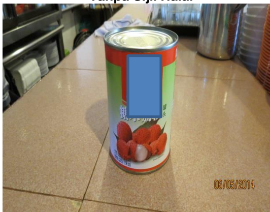
Gambar 3.4 Minuman Laici Tanpa Sijil Halal

Lokasi: Premis Makanan Di Ipoh Tarikh: 6 Mei 2014