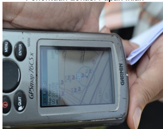
Gambar 1.8 Penentuan Lokasi Papan Iklan

Lokasi: Daerah Hilir Perak Tarikh: 15 April 2014