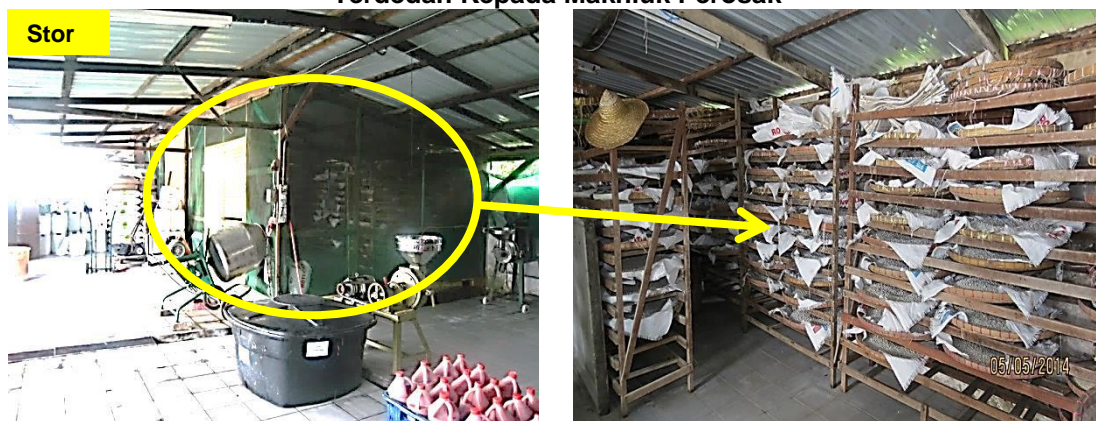
Gambar 3.7 Stor Penyimpanan Bahan Gunaan Utama Produk Terdedah Kepada Makhluk Perosak

Lokasi: Kilang Kicap Dan Sos Di Ipoh Tarikh: 5 Mei 2014