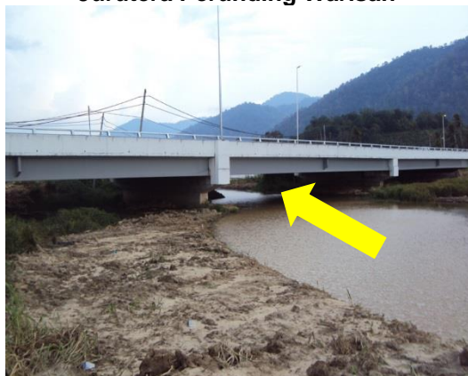
Gambar 2.4 Jambatan Di Sungai Nerok, Kota Tampan Air (Muara) Yang Mengguna pakai Reka Bentuk Jurutera Perunding Warisan

Lokasi: Jambatan Sungai Nerok, Lenggong Tarikh: 23 April 2014