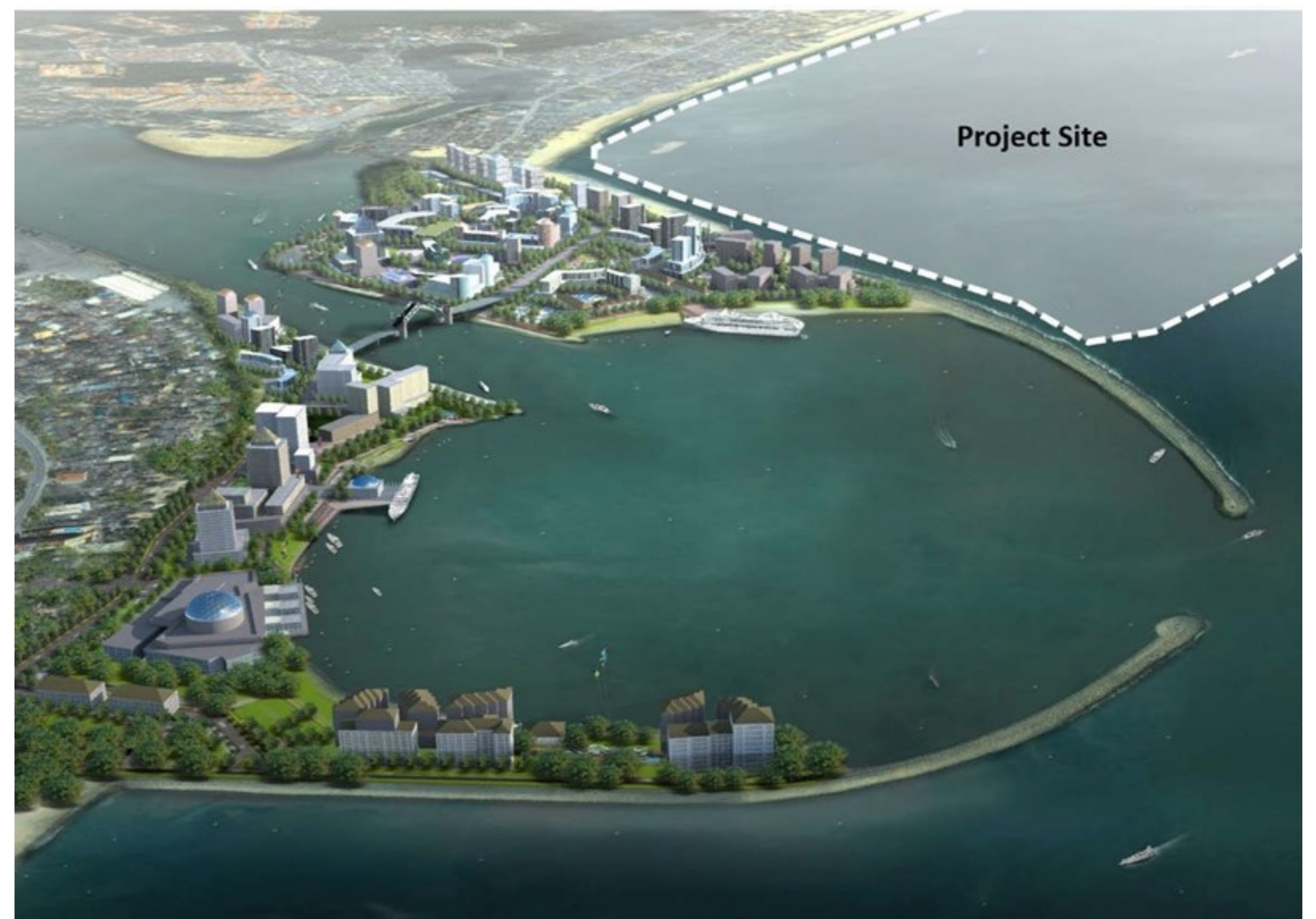
Rajah 3: Projek mega, Kuala Terengganu City Centre (KTCC).