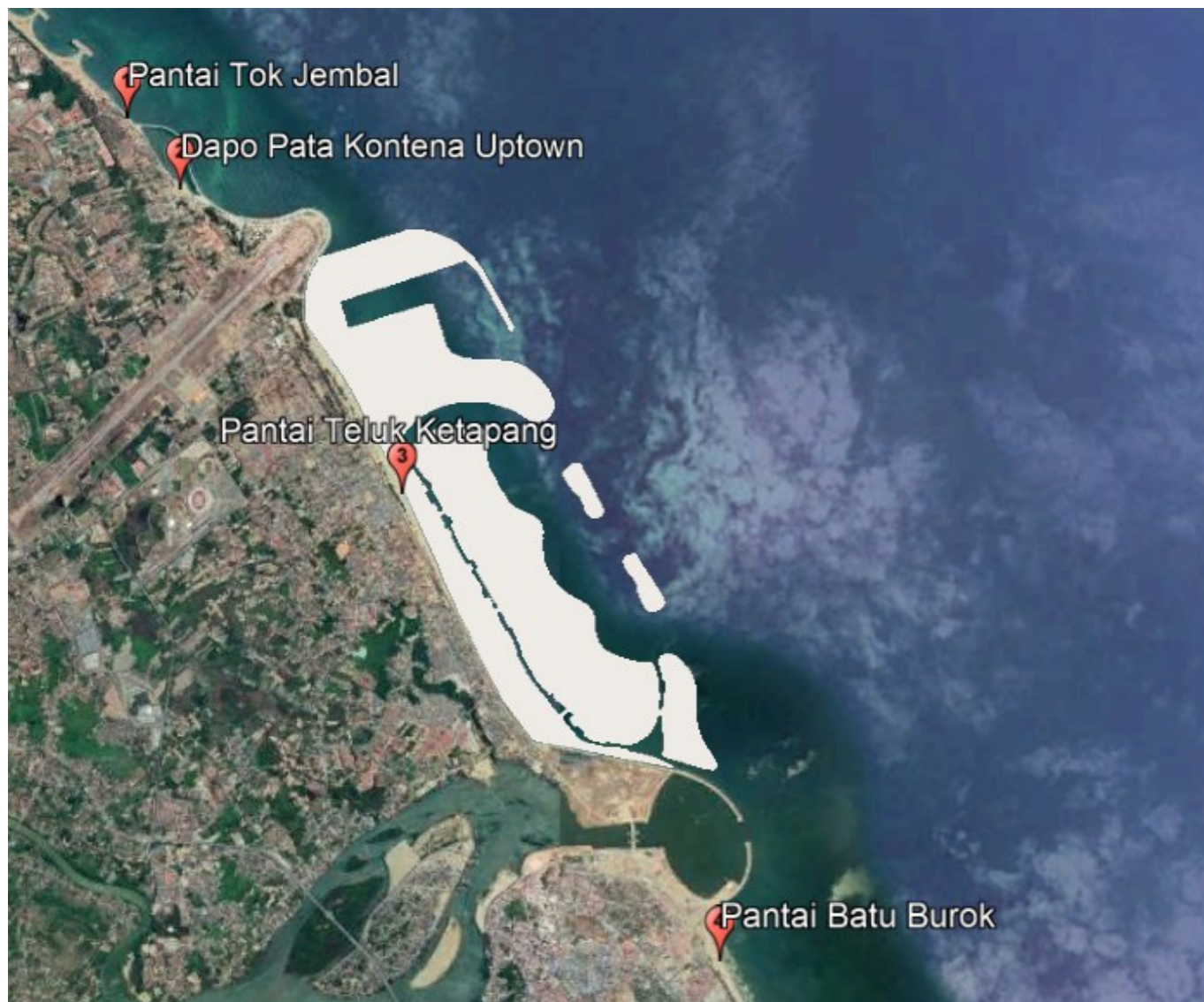
Rajah 1: Kawasan pelancongan berhampiran kawasan projek.