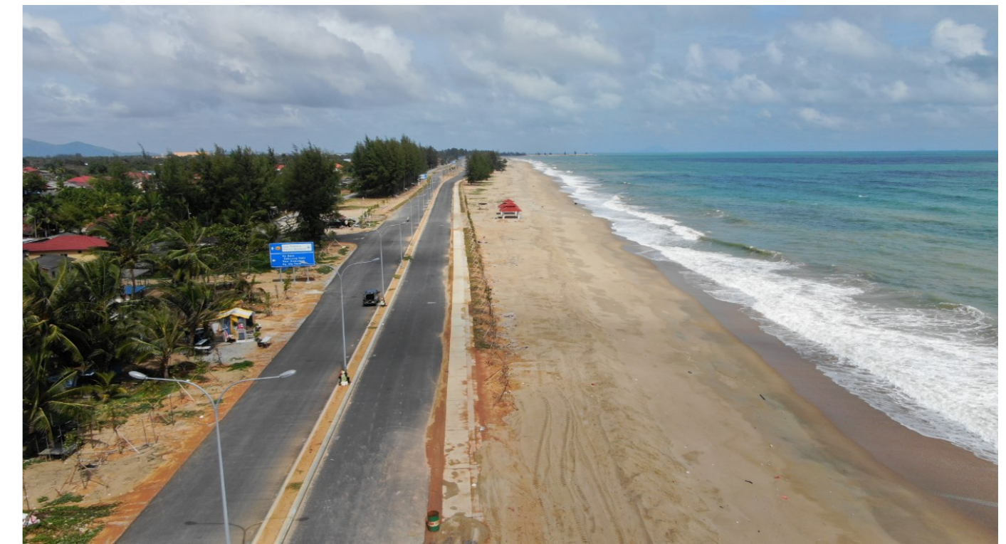
Gambar 1: Pantai Teluk Ketapang.