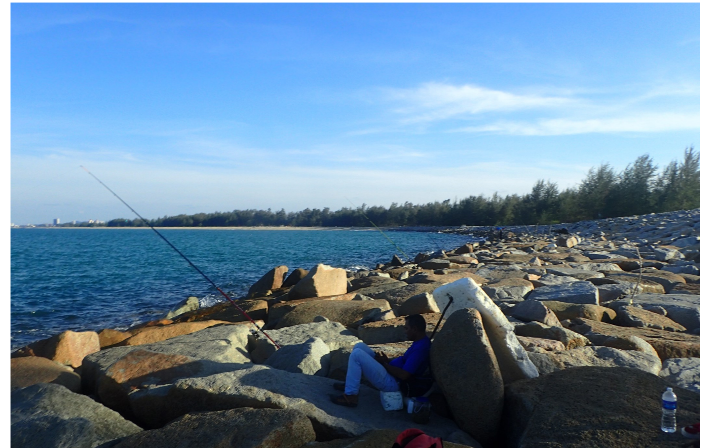
Gambar 3: Aktiviti memancing di Pantai Tok Jembal.