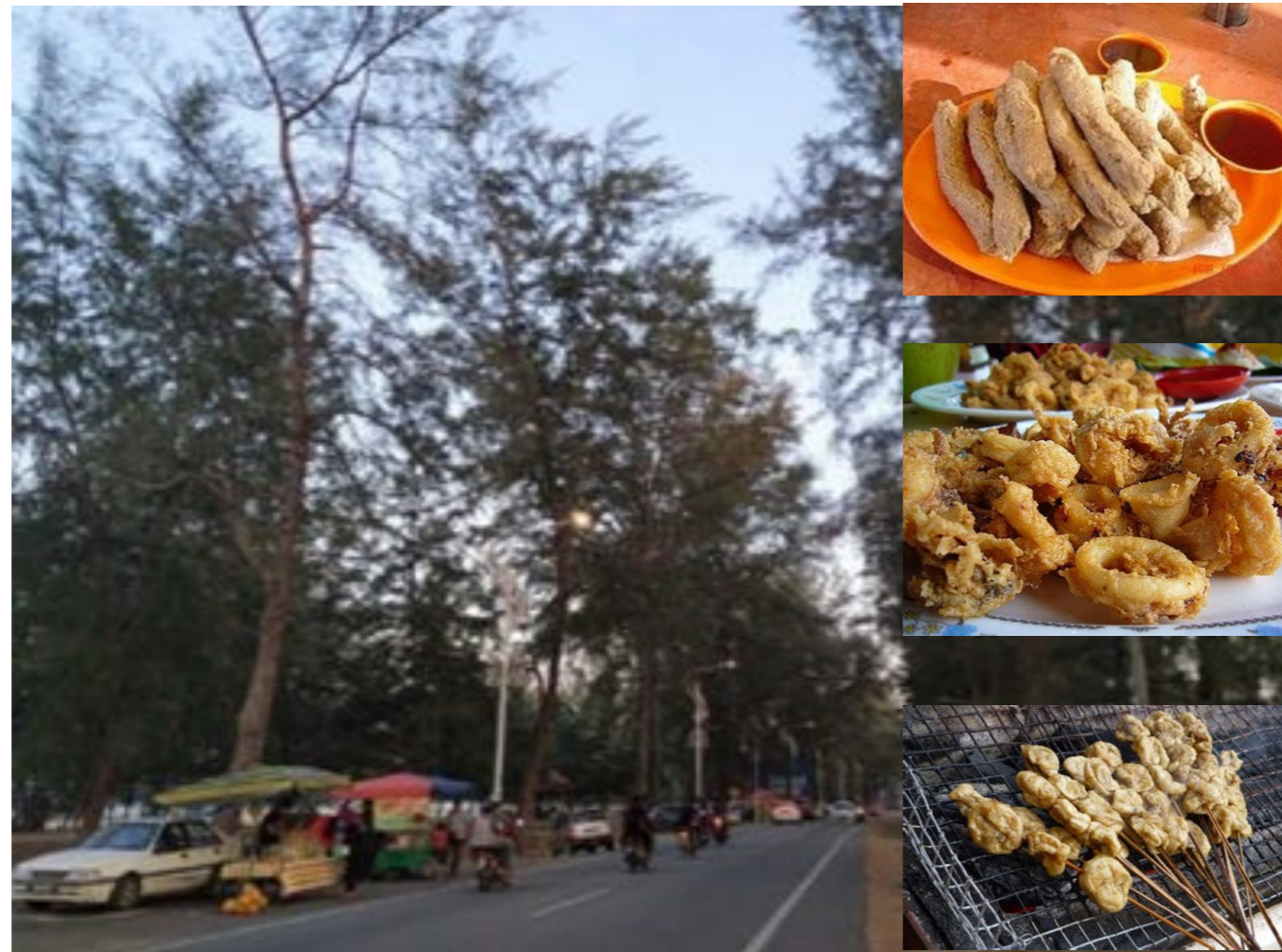
Gambar 2: Keropok lekor, sotong celup tepung dan lok ching adalah antara makanan tempatan yang senang didapati di sepanjang Jalan Pantai Teluk Ketapang.